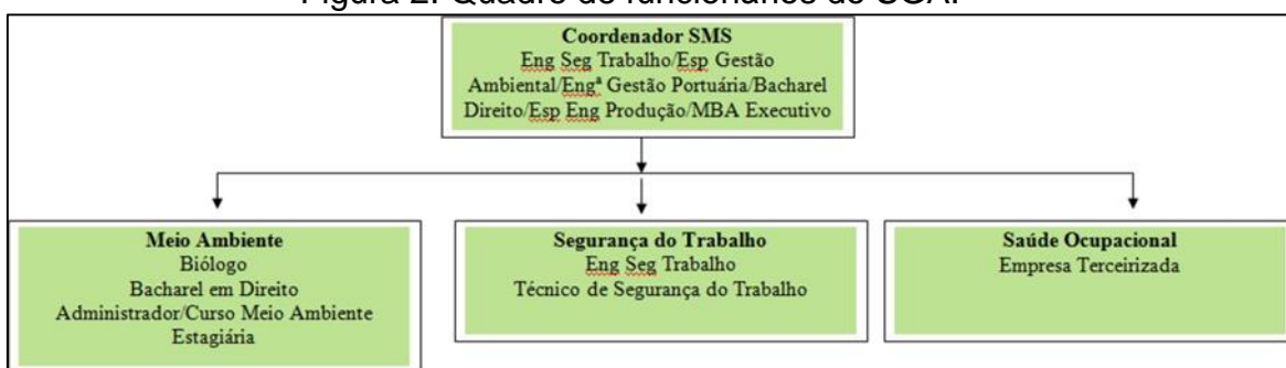
Figura 2: Quadro de funcionários do SGA.

O modelo de gestão se completa com o funcionamento do Conselho de Autoridade Portuária – CAP, órgão permanente independente da estrutura da Empresa, e que articula e integra quatro blocos de partes interessadas no funcionamento do Porto, debatendo ações de caráter administrativo, técnico, operacional e comercial relacionadas ao seu funcionamento.