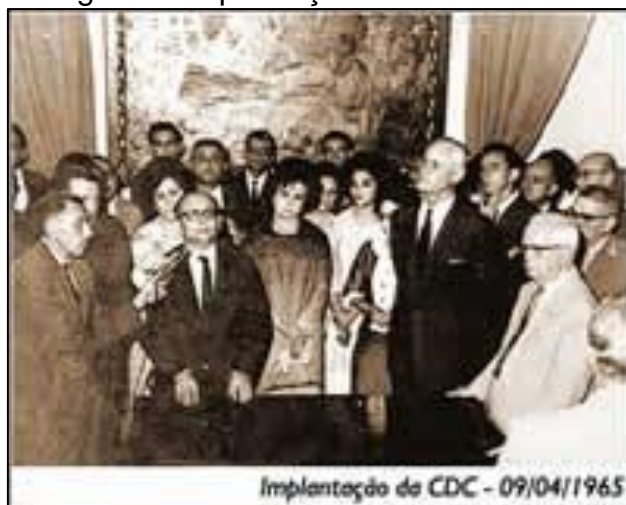
Imagem 3: Implantação da CDC em 1965.