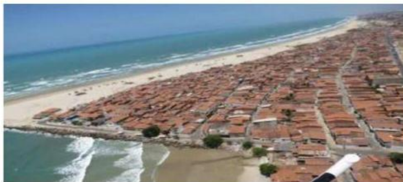
Imagem 1: Molhe de retenção de areia denominada Titanzinho no bairro Serviluz.