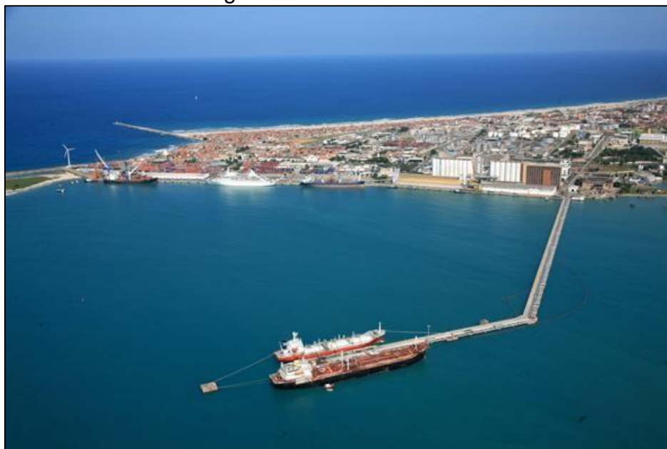
Imagem 4: Porto de Fortaleza.