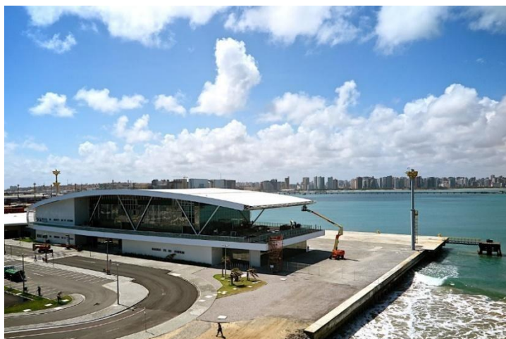
Imagem 2: Terminal Marítimo de Passageiros.