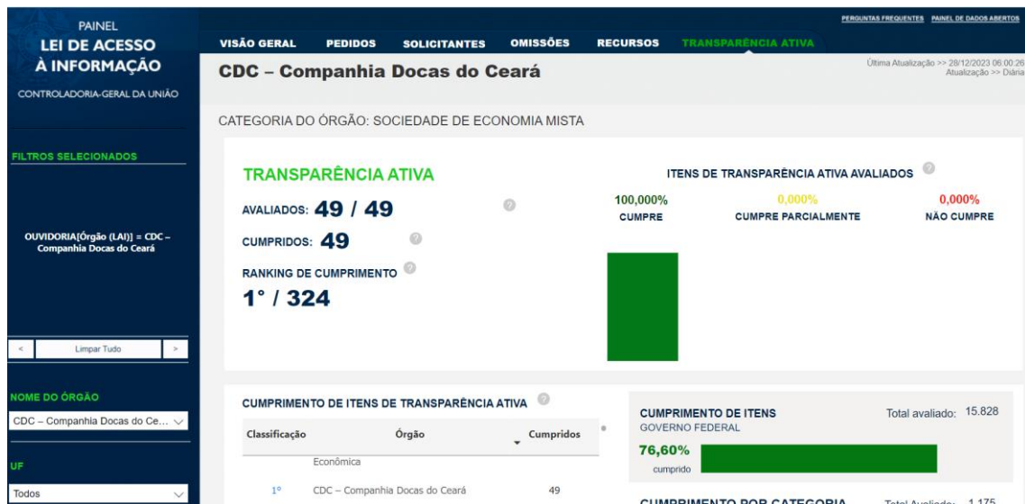
Painel de Transparência – CGU

A CDC continua atendendo 100% dos requisitos de transparência exigidos pela CGU.