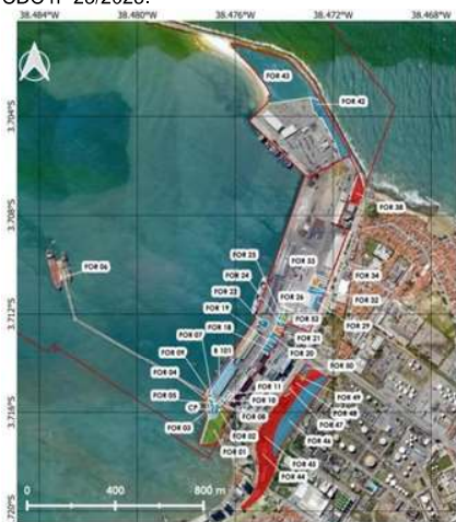
Figura 3 - Poligonal do Porto Organizado de Fortaleza