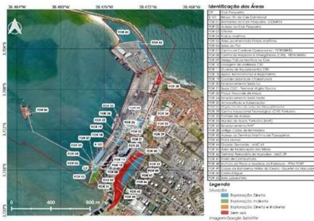
Figura 7 – Áreas não afetadas às operações portuárias –situação atual

O Porto de Fortaleza conta, atualmente, com 31 áreas não afetadas às operações portuárias onde são desempenhadas tanto atividades administrativas e de apoio à operação portuária, quanto de comércio, logística e apoio à pesca. A localização destas áreas encontra-se apresentada na figura 7, enquanto que no detalhe da Figura 8, verifica-se de forma mais aproximada a área do empreendimento denominada de CP – Cais Pesqueiro.