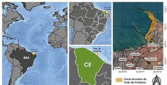
Figura 1 – Localização do Porto de Fortaleza

O Porto de Fortaleza está situado na Enseada de Mucuripe, em Fortaleza, capital do Estado do Ceará, em local de destaque por sua proximidade com grandes centros do mercado mundial, como a Europa e a América do Norte, e com o Canal do Panamá