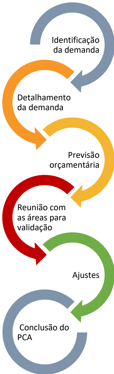
Figura 1 Metodologia aplicada no processo

estabelecidos, cientes de que o PCA contribui sobremaneira para o atendimento de todas as necessidades da Companhia Docas do Ceará.