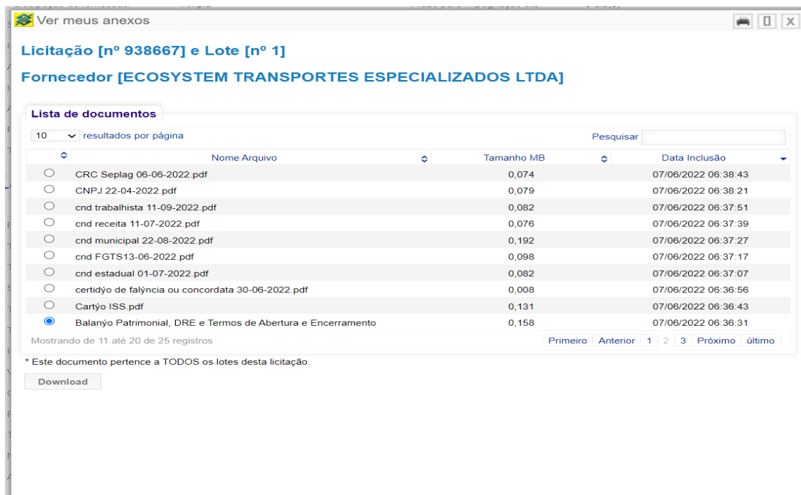
Figura 1 – Print em tela do sistema referente a anexação de documentos no prazo exigido no edital (ver data de inclusão)

Cumpre-se informar que não é verdadeira a alegação de que o balanço patrimonial da Ecosystem foi anexado após o prazo para a inserção da documentação de habilitação no sistema. É importante ressaltar que o balanço patrimonial foi anexado às 06:36:31 do dia 07/06/2022, portanto antes do prazo estabelecido, conforme demonstrado no print da tela abaixo.