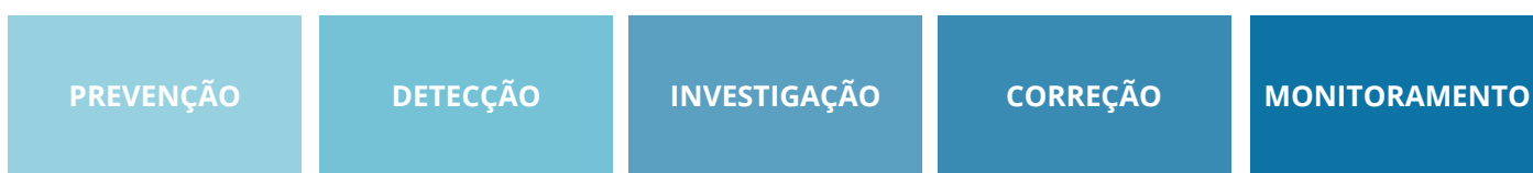
Figura 2 - Referencial de combate à fraude e corrupção (TCU)

A CDC, em sua gestão da integridade, adota os EIXOS de integridade previstos no Referencial de Combate à Fraude e Corrupção do TCU, que consistem nos pilares de prevenção, detecção, investigação, correção e monitoramento, onde são estruturadas as ações para o combate dos desvios.