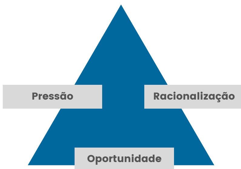
Figura 3 - Condições de fraude ou corrupção (Donald Cressey)