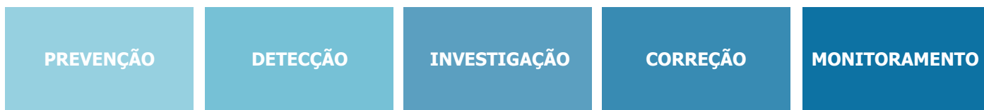
Figura 2 - Referencial de combate à fraude e corrupção (TCU)

A CDC, em sua gestão da integridade, adota os EIXOS de integridade previstos no Referencial de Combate à Fraude e Corrupção do TCU, que consistem nos pilares de prevenção, detecção, investigação, correção e monitoramento, onde são estruturadas as ações para o combate dos desvios.