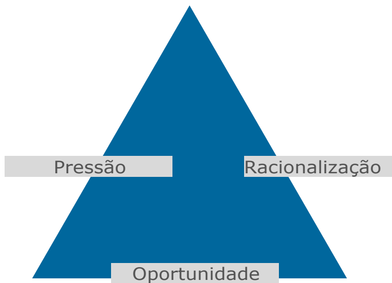
Figura 3 - Condições de fraude ou corrupção (Donald Cressey)