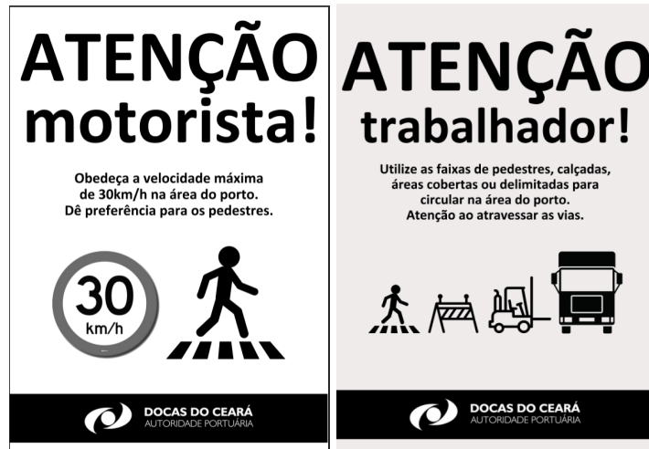
Figura 1: Modelo dos panfletos e posters distribuídos.