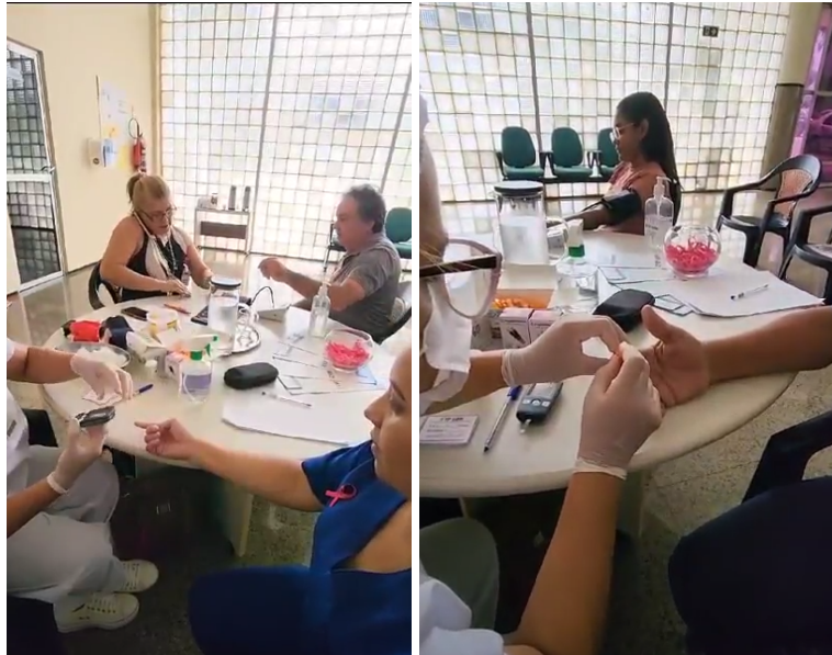
Figuras 15 e 16: Realização do Dia D.

No dia 20/10/2023 foi realizado o "Dia D", com o Circuito de saúde, com medição de pressão e glicemia em jejum.