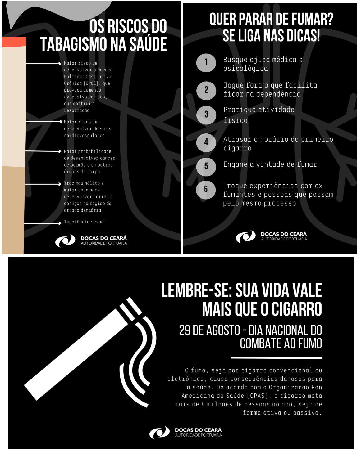
Figuras 10, 11 e 12: (11) e (10) posters de divulgação e (12) Wallpaper de computador.