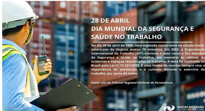
Fig. 3: Wallpaper com divulgação em todos os computadores da empresa.