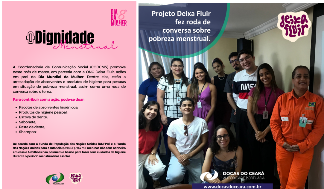
Figura 4 e 5: Divulgação sobre o tema e convite (fig. 4) e Palestra (fig. 5)

Foi realizada uma arrecadação de absorventes na empresa, divulgação do assunto por meio de posters e via e-mail e roda de conversa sobre dignidade menstrual com o grupo "deixa fluir".