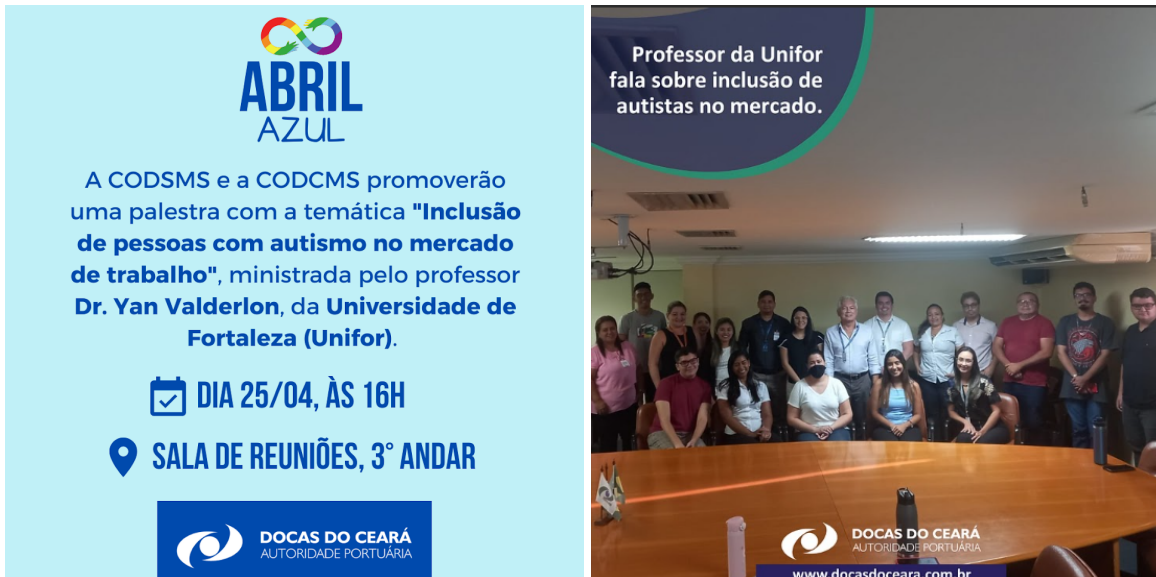
Fig. 7 e 8: Divulgação online (fig. 7) e palestra (fig. 8).

Foi realizada uma divulgação sobre o tema e convite da palestra através de correios eletrônicos e uma palestra com o tema "Inclusão de pessoas com autismo no mercado de trabalho".