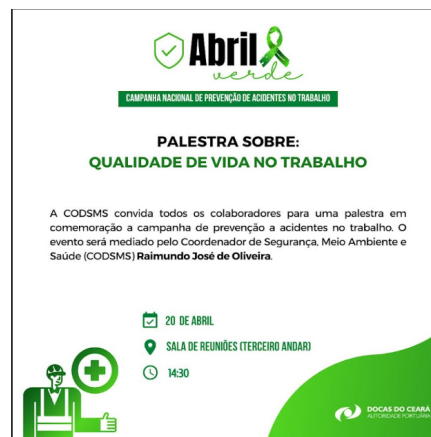
Fig. 2: Convite para a palestra de Qualidade de Vida no Trabalho

Foi realizado a divulgação de posters sobre o assunto via e-mail, mural e site; palestra com tema: "Qualidade de vida no trabalho" e a wallpaper com divulgação sobre o tema em todos computadores da empresa