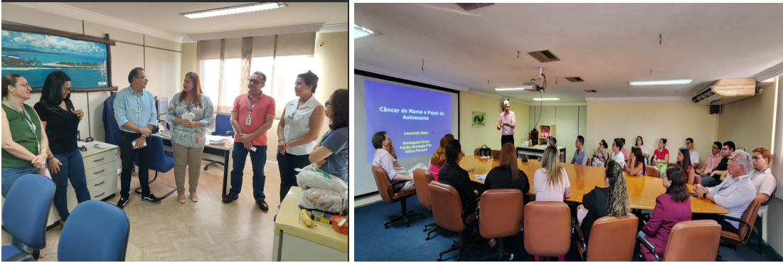
Figuras 13 e 14: (13) Divulgação do assunto na empresa e (14) Palestra com o tema “câncer de mama”.